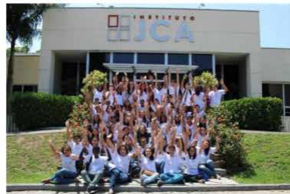
Os interessados deverão se inscrever pelo formulário disponível no site do IJCA.

ESCRITO POR REDAÇÃO 08/18/2021 06:40, ATUALIZADO EM 08/18/2021 07:30